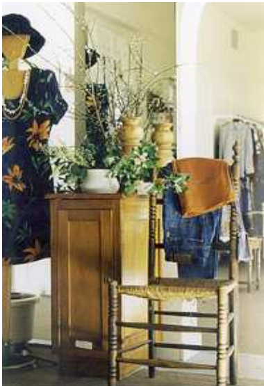
In 12 verschillende winkels worden allerlei goederen keurig gepresenteerd.

Stedenkontakt ondersteunt in Bialystok mensen die zich door armoede, ziekte of handicap bevinden aan de rand van de Poolse samenleving.